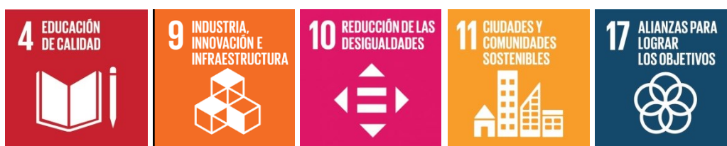
Figura 3 – Objetivos de Desarrollo Sostenible (ODS)

Complementariamente, SION considera que este Proyecto también concurre con los siguientes Objetivos de Desarrollo Sostenible (ODS) de las Naciones Unidas: ODS 4 – Educación de Calidad; ODS 9 – Industria, Innovación e Infraestructura; ODS 10 – Reducción de Desigualdades; ODS 11- Ciudades y comunidades sostenibles y ODS 17- Alianzas para lograr los objetivos.