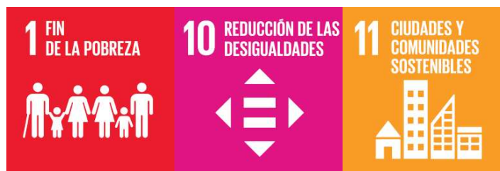
Figura 4 – Objetivos de Desarrollo Sostenible (ODS)

Un aspecto sustantivo del nuevo proyecto, lo constituyen las directrices que en materia de Investigación y Desarrollo, TECHO contemplará para las actividades del emprendimiento. Las mismas se orientan a mejorar los diversos aspectos relacionados con las viviendas dirigidas a sectores populares. En ese sentido se destacan: