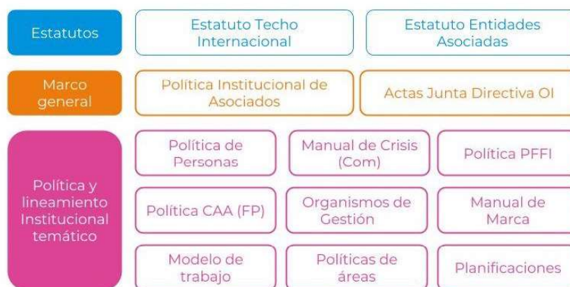
Figura 3 - Estructura organizacional de TECHO Internacional

Para lograr dicho cometido, cuenta con Estatutos tanto de TECHO Internacional como de cada entidad asociada; un marco general donde se determina la política institucional y con las diferentes políticas y lineamientos específicos de cada tema. La siguiente Figura 3 explica cómo se organiza cada oficina (entidad asociada):