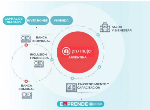
Figura 1 – Actividades realizadas por PMA

A su vez, en el Prospecto de emisión, se menciona que el impacto positivo buscado por las actividades de PM en los Objetivos de Desarrollo Sostenible (ODS) de la Organización de las Naciones Unidas son los siguientes, para los cuales presenta distintos indicadores para medir su impacto: