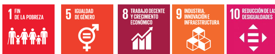
Figura 2 – Impacto buscado en los Objetivos de Desarrollo Sostenible (ODS) en los créditos a otorgar